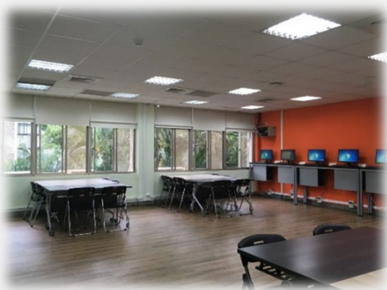
資管系系機房：提供同學討論自學 使用，伯達樓 BS309