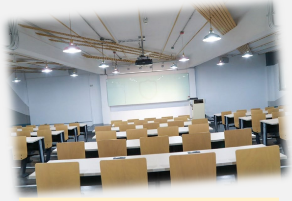
資管系專用教室 伯達樓 BS440