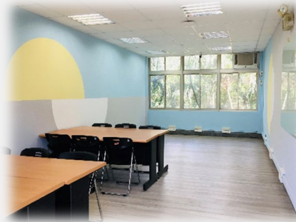
資管系專題實驗室五間 伯達樓 BS2F、3F (大三專題期間使用)