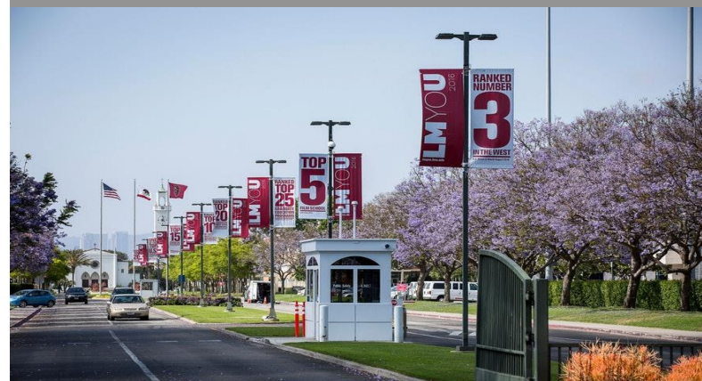
Loyola Marymount University