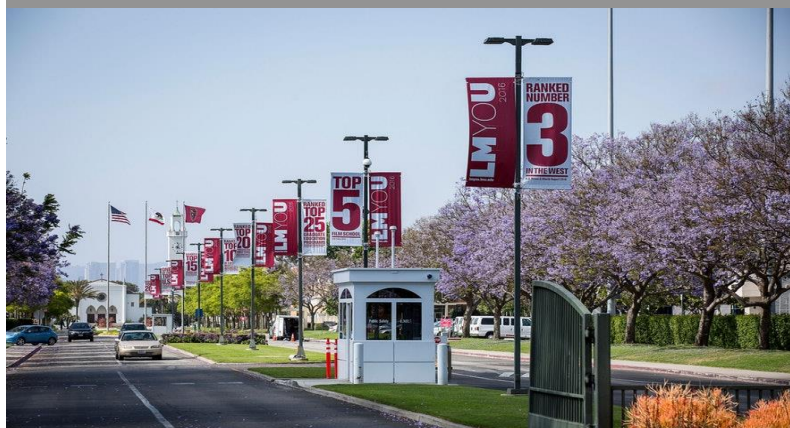
Loyola Marymount University