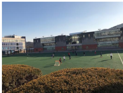
(左為校園內場景，右為國民大學大門)