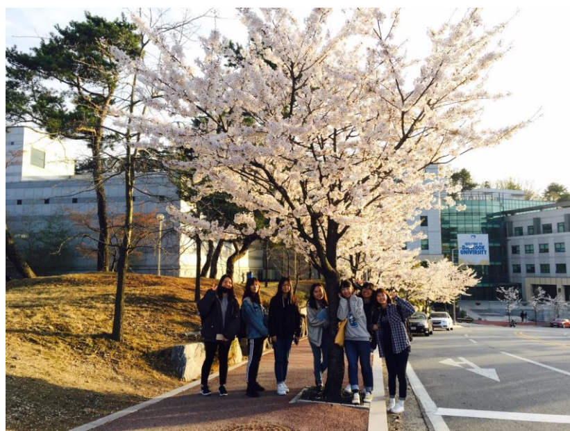
↑ 學校開櫻花的時候