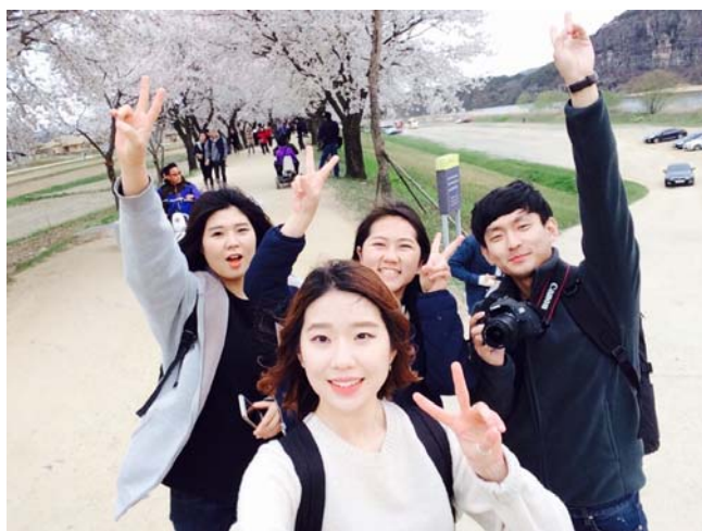
和韓國朋友去安東旅行