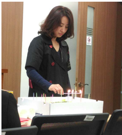
←韓文老師認真的在蛋糕上點蠟燭

韓文課比較適合從來沒學過或是只會一點的人，程度較好的人就要自己去找適合自己程度的課。但是這堂課，老師人非常好，除了上課外，我們還會看韓國電影，如果同學生日還有生日派對，老師都會提供飲料、零食甚至生日蛋糕，和同學在班上一起慶祝生日，還在白板上寫下各國的生日快樂！