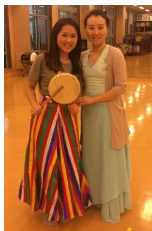
↑ 第二種鼓和老師合照