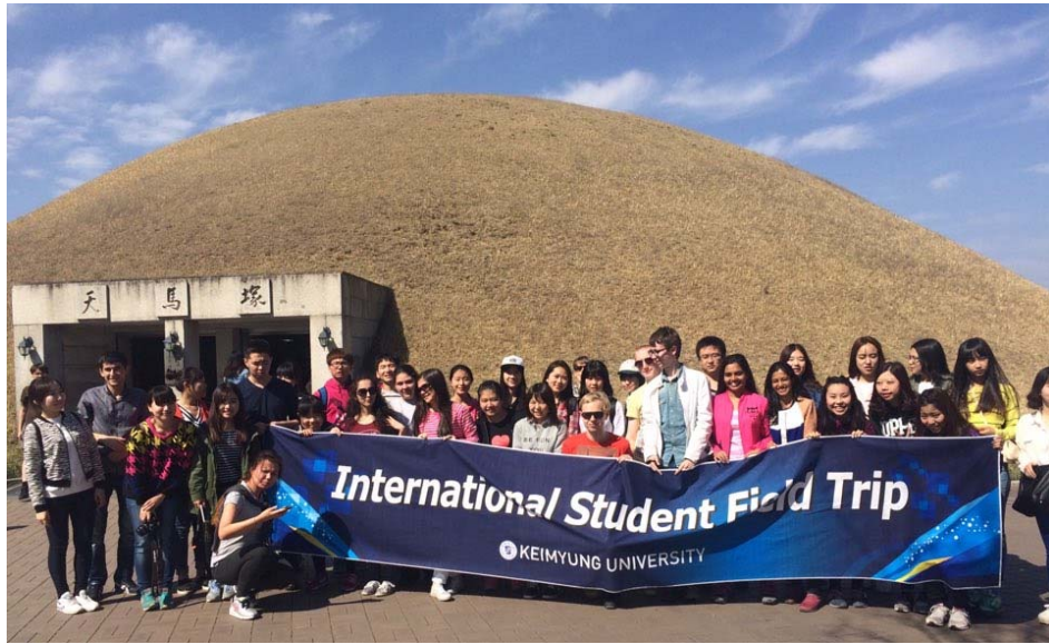
↑ 舉辦給每年新來交換生的Field trip (慶州)