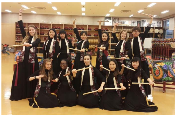
↑ 第一種鼓的表演服大合照

專門開給交換學生的 韓國舞蹈 ，原本以為主要是學習舞蹈，沒想到老師竟然是教我們打韓國傳統的鼓，而打鼓的中間會搭配一些舞蹈動作，所以剛開始讓有些同學覺得失望，但大家漸漸喜歡上打鼓，覺得打鼓也是一門學問，喜歡一起練習然後無錯誤的結束，那是一種成就感。在學期的最後一堂課老師讓我們換成他們舞蹈系學生的表演服，然後錄影當成期末考，每個人都聚精會神地演奏，好多朋友都很羨慕我選了這堂課，這可是旅行團不會搭配的行程，專屬於交換生才能有的體驗！