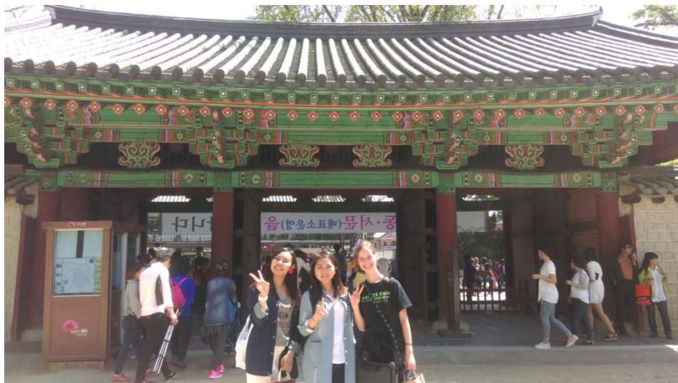
↑ 和朋友去全州旅行