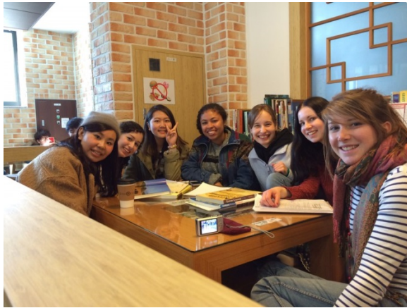
↑ 在 international lounge 和同學的合照