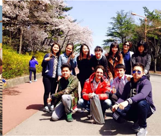
↑ international lounge 舉辦的 大邱頭流公園賞櫻