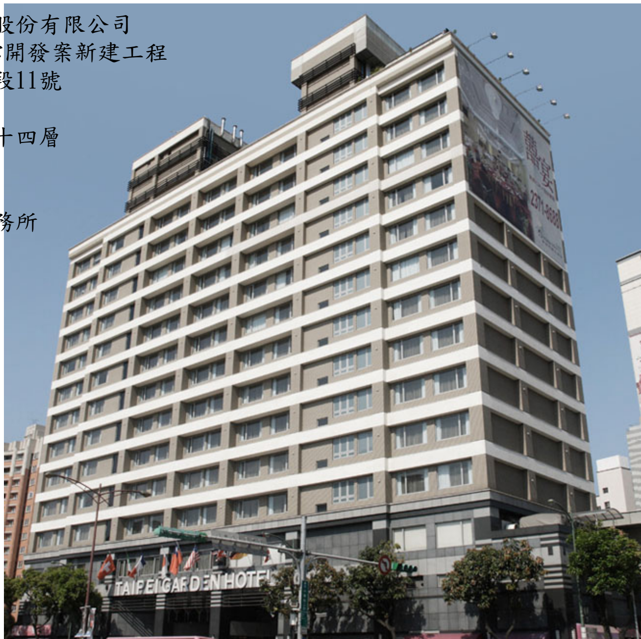
中華路BOT案旅館開發案新建工程

業主：台北花園大酒店股份有限公司 工程名稱：中華路BOT案旅館開發案新建工程 工程地點：台北市中華路二段11號 總樓地板：22,248.2 m 2 結構規模：地下二層、地上十四層 工法：RC造 用途：觀光飯店 建築設計：蔡達寬建築師事務所