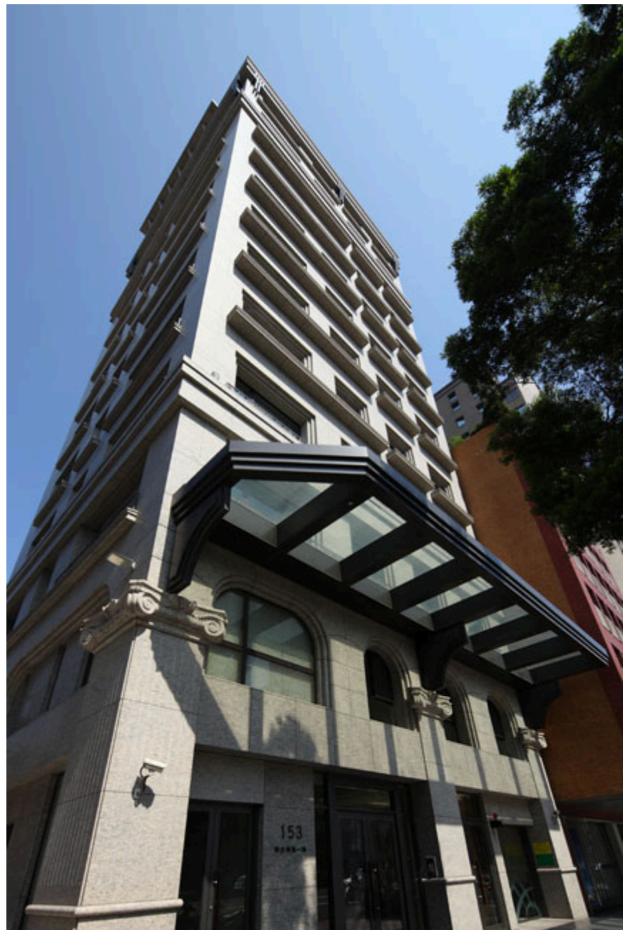
聯智建設-大安帝國新建工程

業 主：聯智建設股份有限公司 工程名稱：大安帝國新建工程 工程地點：台北市新生南路一段 總樓地板：3,987m 2 結構規模：地下3層，地上12層 工 法：RC造 用 途：高級住宅 建築設計：創瓊建築師事務所