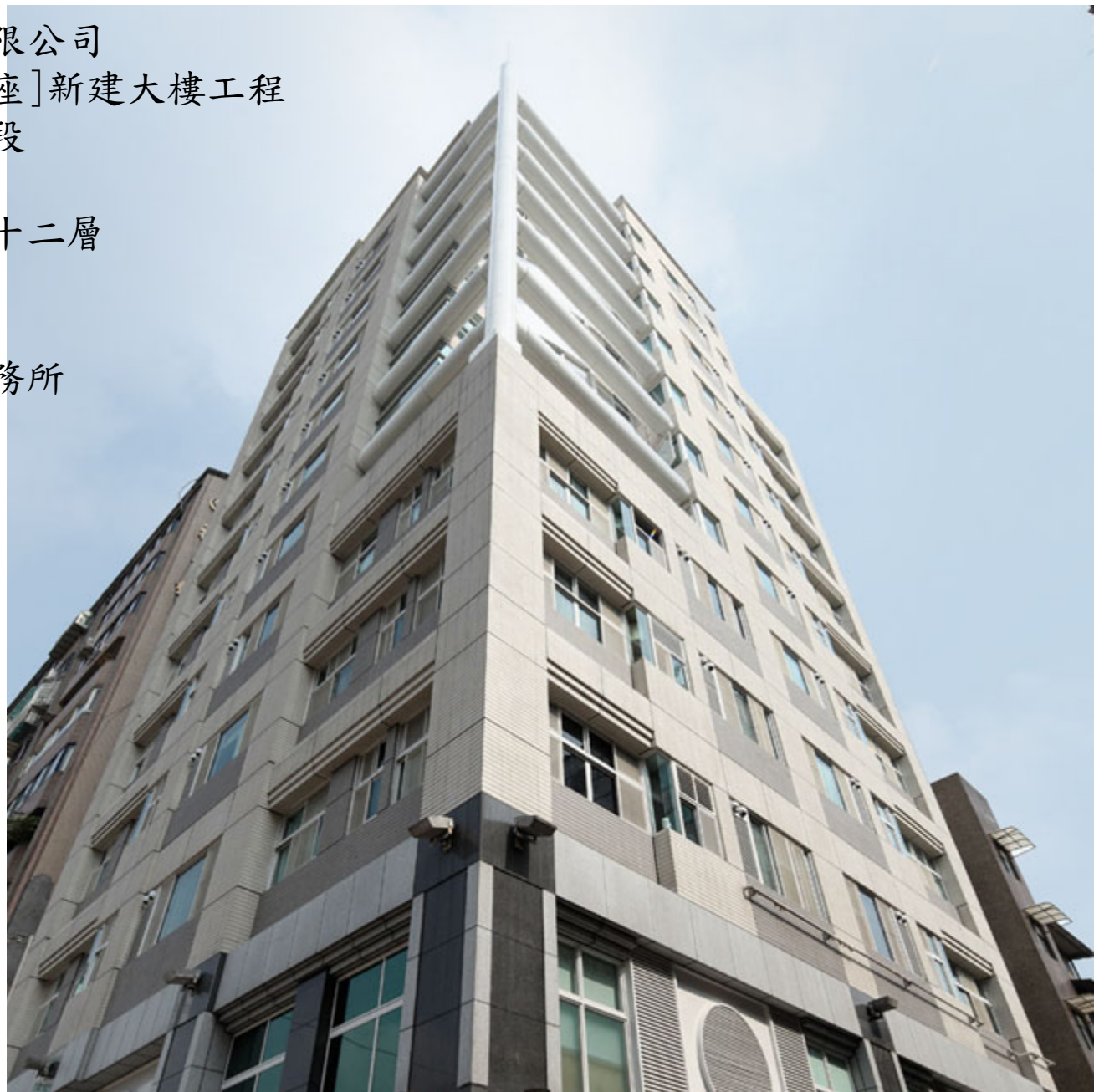
順嘉建設-[敦北.傑座]新建大樓工程

業主：順嘉建設股份有限公司 工程名稱：八德路[敦北.傑座]新建大樓工程 工程地點：台北市八德路三段 總樓地板：3,757.83 m 2 結構規模：地下三層，地上十二層 工法：SC造 用途：集合住宅 建築設計：張燦中建築師事務所