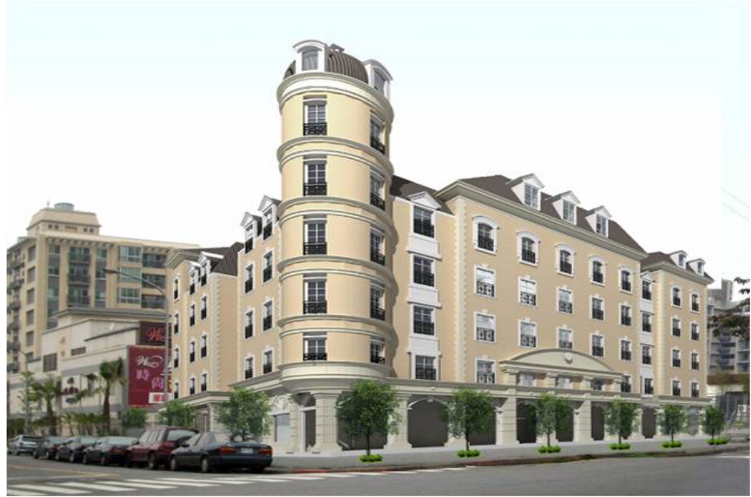
麒麟商務會館新建工程

業主：麟揚股份有限公司 工程名稱：麒麟商務會館新建工程(建築工程)(水電工程) 工程地點：台北市南港區重陽路 總樓地板：7,865.16 m 2 結構規模：地下2層、地上5層 工法：RC造 用途：商務會館 建築設計：蔡達寬建築師事務所