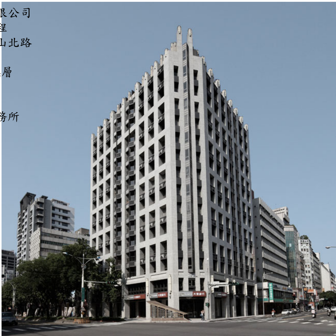
亞昕開發-亞昕首藏新建工程

業主：亞昕開發股份有限公司 工程名稱：亞昕首藏新建工程 工程地點：台北市中山區中山北路 總樓地板：14,040.14 m 2 結構規模：地下6層、地上14層 工法：SRC造 用途：高級住宅 建築設計：周泰良建築師事務所