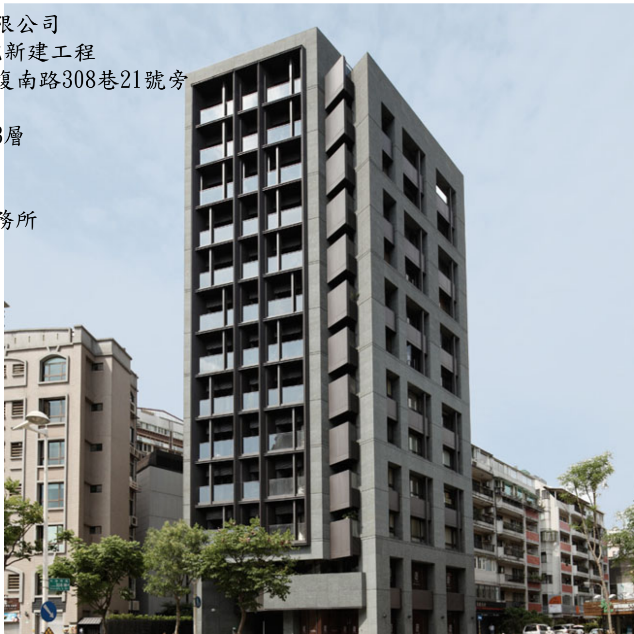
名豐建設-名豐A案集合住宅新建工程

業主：名豐建設股份有限公司 工程名稱：名豐A案集合住宅新建工程 工程地點：台北市中正區光復南路308巷21號旁 總樓地板：2,244.32 m 2 結構規模：地下1層、地上13層 工法：RC造 用途：高級住宅 建築設計：郭旭原建築師事務所