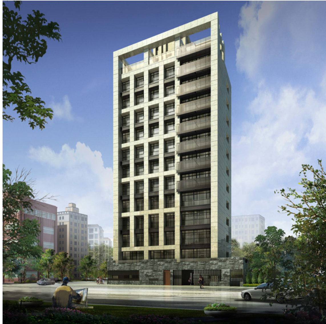
立陞建設-臨沂馥玉新建工程