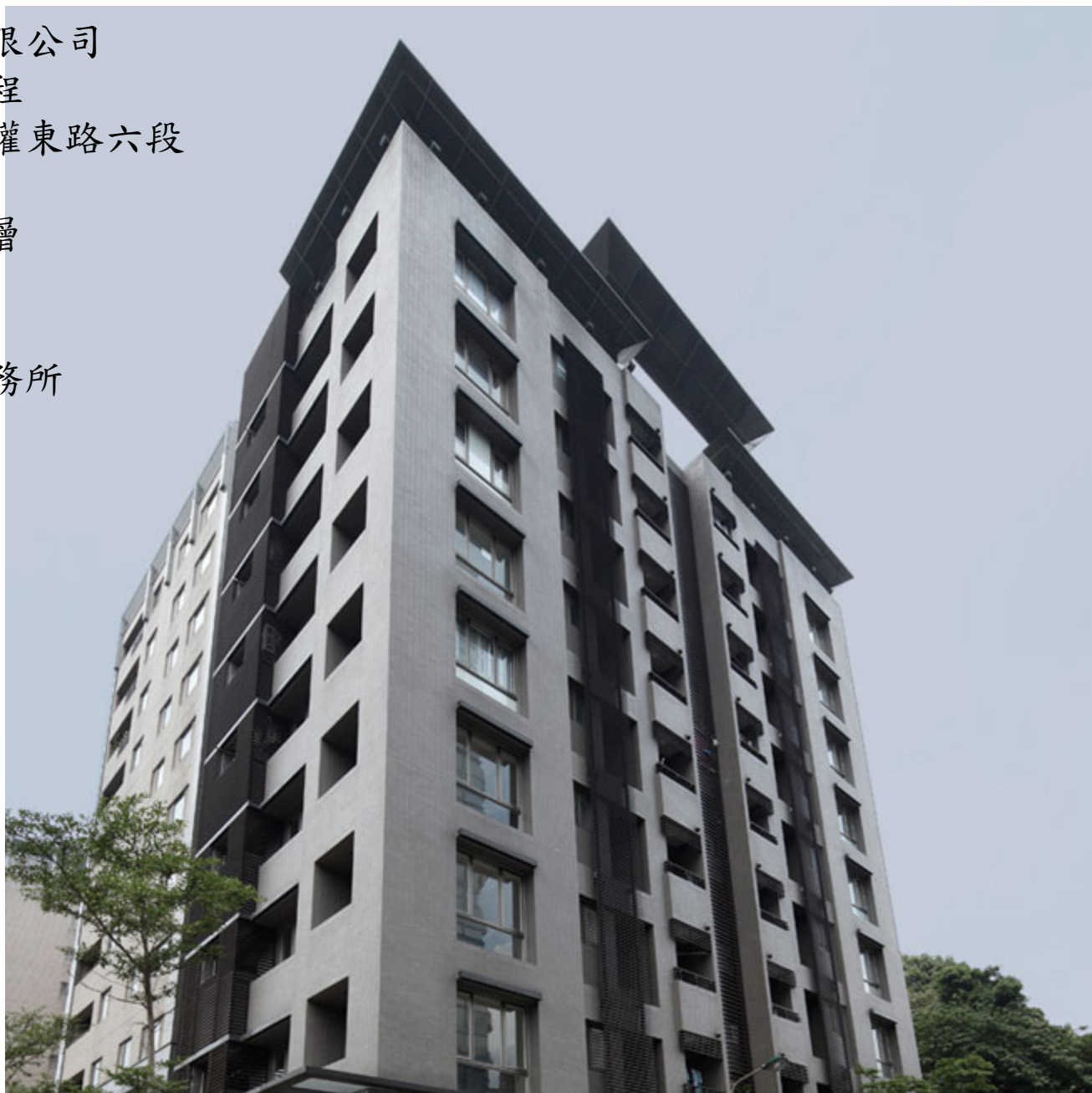
立樺建設-『湖砌』新建工程

業主：立樺建設股份有限公司 工程名稱：『湖砌』新建工程 工程地點：台北市內湖區民權東路六段 總樓地板：3,292.76m 2 結構規模：地下3層、地上9層 工法：RC造 用途：高級住宅 建築設計：吳成榮建築師事務所