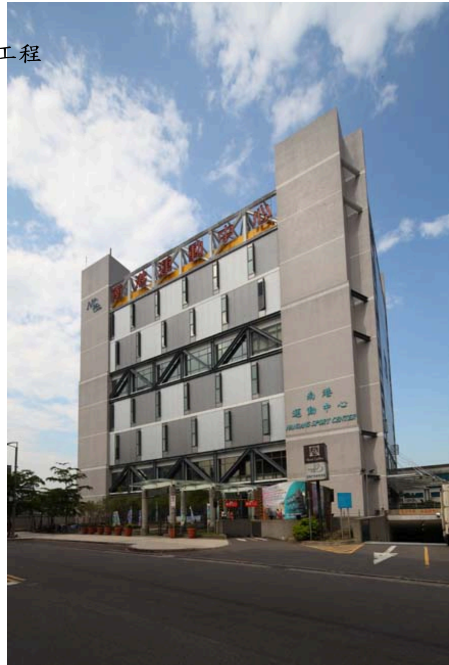
台北市南港區市民運動中心新建統包工程

業主：台北市政府工務局新建工程處 工程名稱：台北市南港區市民運動中心新建統包工程 工程地點：台北市玉成街38巷對面 總樓地板：17,539.83 m 2 結構規模：地下4層，地上8層 工法：逆打連續壁工法 用途：市民運動中心 建築設計：宗邁建築師事務所